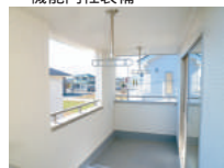
広く使いやすいインナー バルコニー