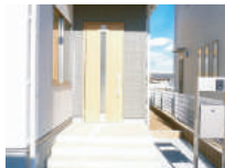
スマートコントロールキー 機能門柱装備