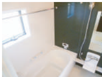
浴室乾燥機付ユニットバス