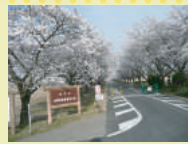
藤岡渡良瀬運動公園:約450m